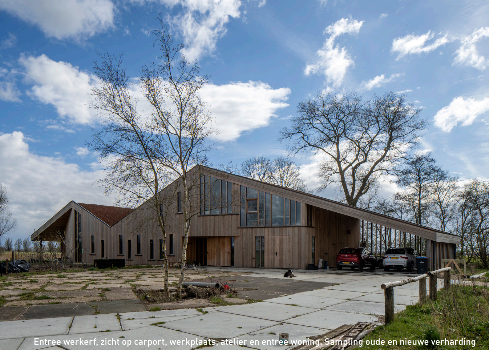
Entree werkerf, zicht op carport, werkplaats, atelier en entree woning. Sampling oude en nieuwe verharding