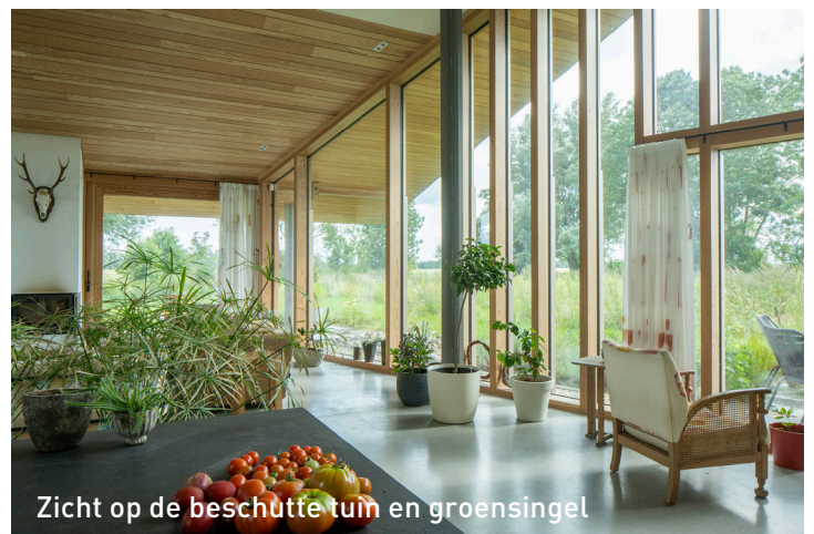
Zicht op de beschutte tuin en groensingel