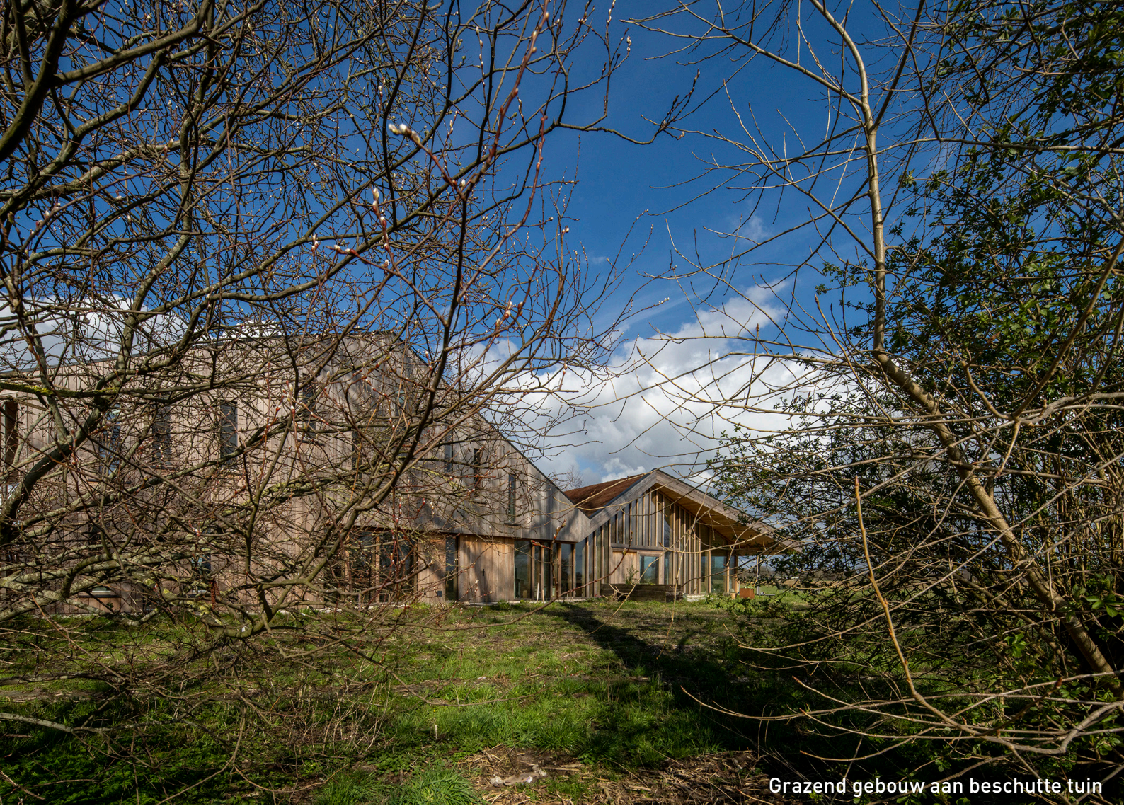
Grazend gebouw aan beschutte tuin