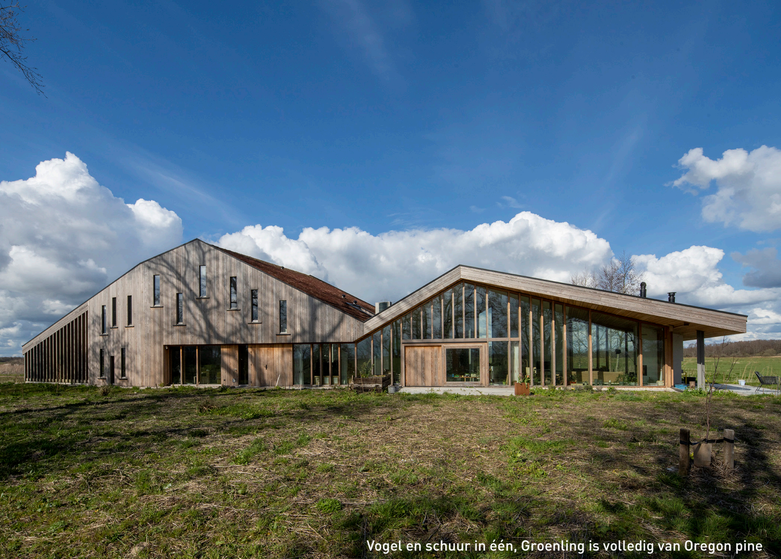
Vogel en schuur in één, Groenling is volledig van Oregon pine