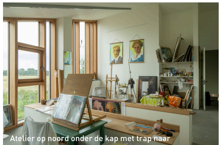
Atelier op noord onder de kap met trap naar