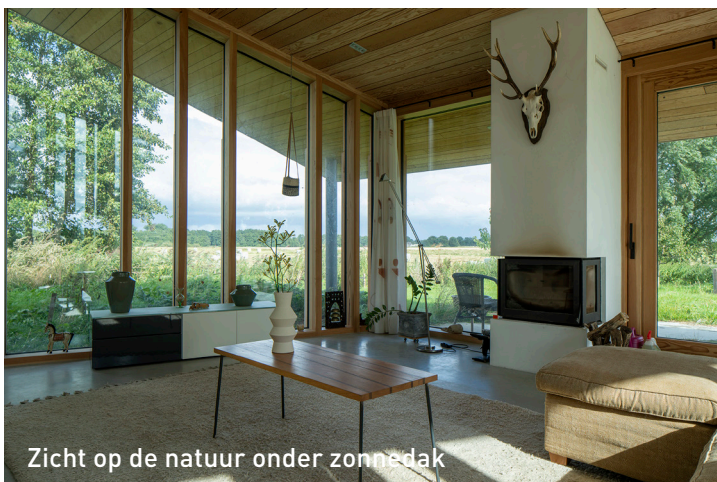
Zicht op de natuur onder zonnedak